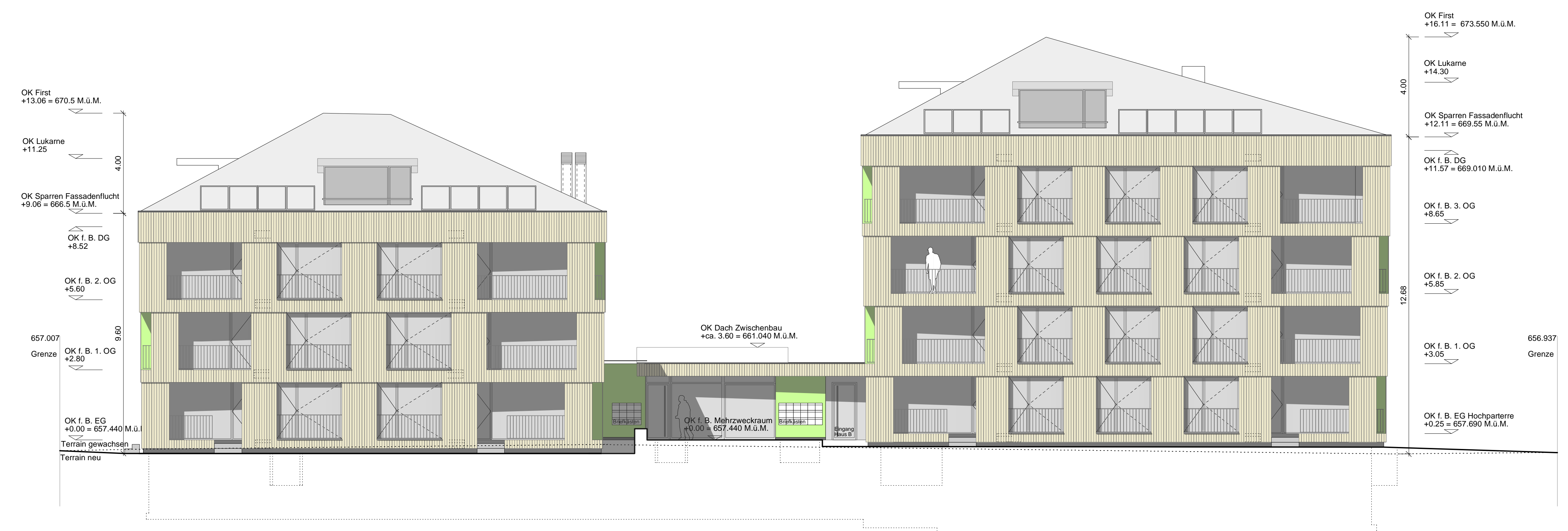
Ansicht Süd Haus A