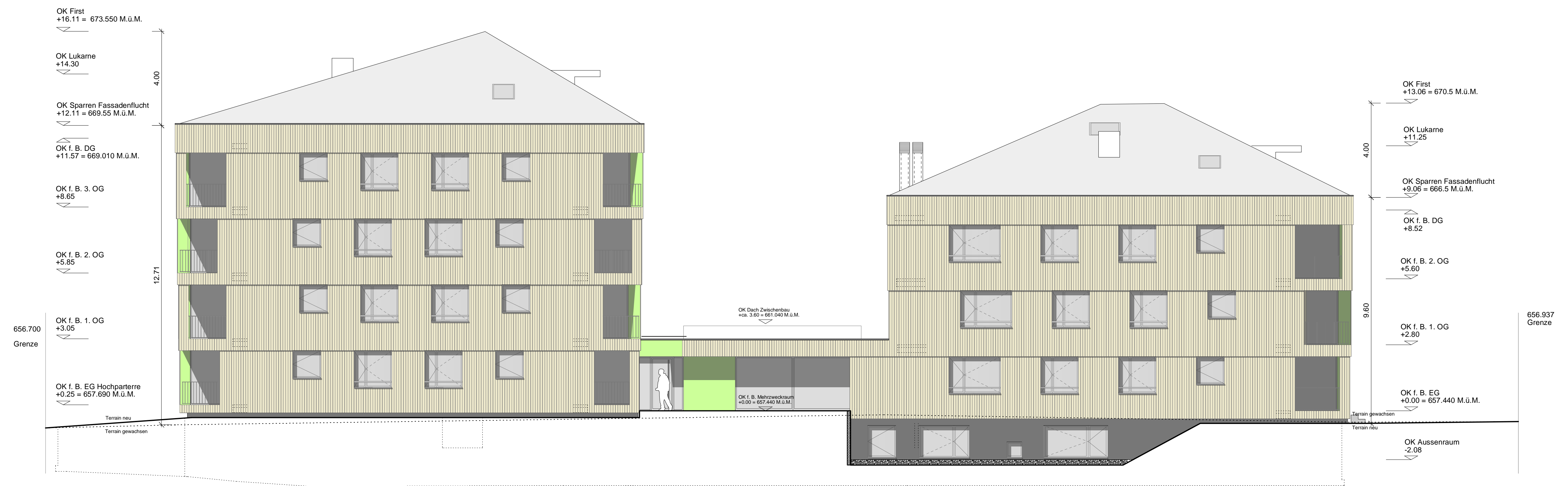
Ansicht Nord Haus B